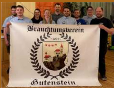
Wir freuen uns auf die nächsten drei Jahre!